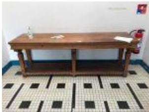
LOT N° 98 1 COMPTOIR CHÊNE