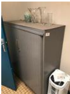
LOT N° 99 1 TABLE RONDE MÉLAMINÉE 3 CHAISES TISSU MARRON 1 ARMOIRE BASSE MÉTAL GRIS 1 ARMOIRE...